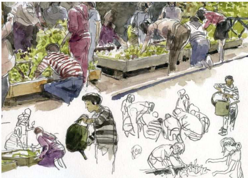
Illustration : Denis Clavreul

En 4 ans, plus de 7000 élèves ont pu participer à la création de jardins dans leurs écoles. En effet, chaque année, 50 à 100 classes de l'agglomération nantaise se sont inscrites à l'opération et ont ainsi bénéficié de l'accompagnement technique et financier d'Écopôle et de ses partenaires (kits de jardinage, accompagnement pédagogique, journées d'accueil, ateliers thématiques, spectacles,...).