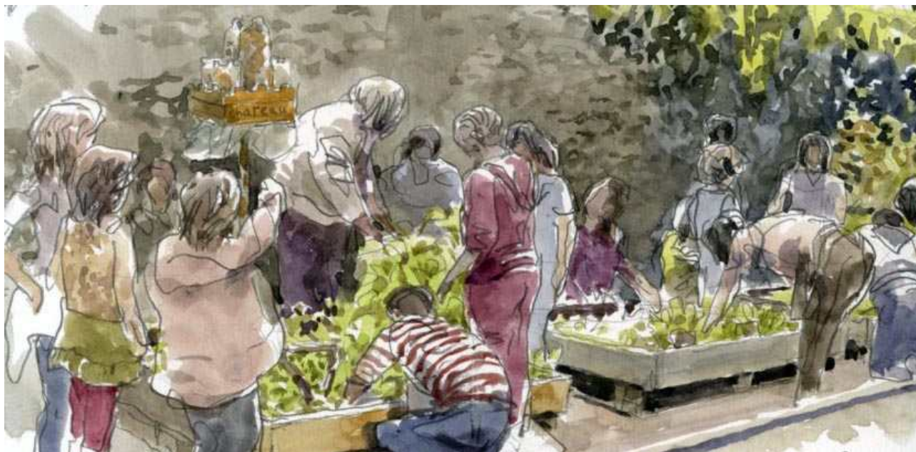
Illustration : Denis Clavreul

écoles, au Jardin des Plantes de Nantes du 2 au 10 juin 2012.